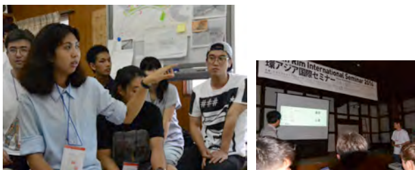
ワークショップ中間発表・討論

2014年8月、佐賀県鹿島市肥前浜宿の酒蔵や茅葺町家を貸し切って、日・韓・タイ・カザフスタンの建築・都市デザイン研究者や学生が集い、「グローバル社会における文化多様性と歴史的環境の保全活用」について4泊5日で議論しました。学生たちは、肥前浜宿のまちの課題を調査し、提案物を作成し地域住民に発表しました。